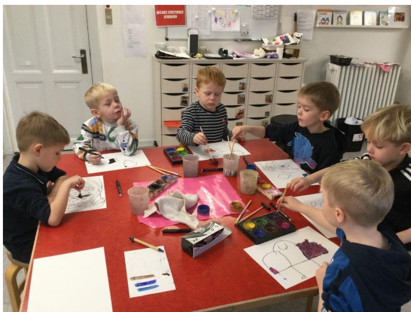
Legegruppe i et læringsmiljø, hvor der er fokus på det kreative

Vi arbejder til stadighed med at kunne tilbyde en høj kvalitet af vores pædagogiske arbejde. Derfor er hver dag struktureret, hvilket betyder at pædagogerne har planlagt fagligt velfunderede aktiviteter for børnene. Aktivitetsplan kan ses på AULA.