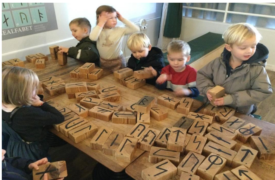
MIX-gruppen arbejder med Runer

Målet med dette er, dels at børnene får et kendskab til hinanden inden de starter på Rødstue, og dels er det en måde, hvor vi specifikt kan tilgodese årgangens udvikling og læring. Ligeledes med den årgang der er tilbage på den enkelte stue.